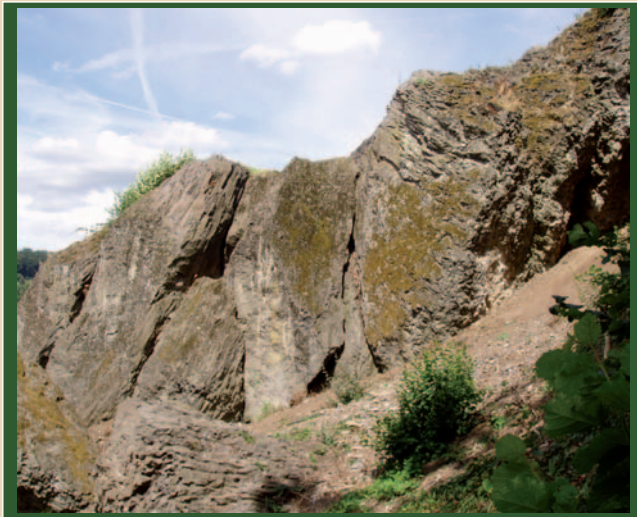
Alte Abbaustelle an der Westseite des Wilden Steins vorn mit verkippten Blöcken und dahinter mit erkennbarer „Meilerstellung“ der Säulen.

Erst spät scheint der Wilde Stein als Steinbruch genutzt worden zu sein, um z.B. die Büdinger Strassen zu pflastern. Dazu wurden Teile der Felsen auch gesprengt, was heute noch an den Abbaustellen und den verkippten Blöcken erkennbar ist. Nach Unterlagen des Büdinger Archivs war dies z.B. zu napoleonischer Zeit der Fall.