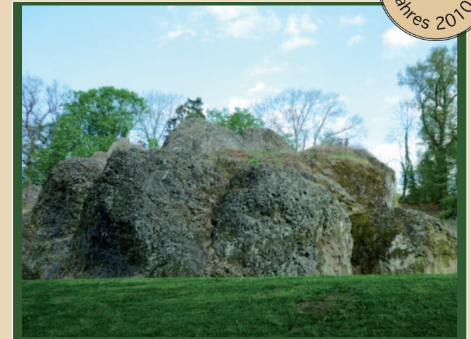
Die rechts oben auf dem wilden Stein stehenden Menschen wirken winzig im Vergleich zu den großen Felsen des Wilden Stein

Geotope bieten Gelegenheit, Erdgeschichte an einem konkreten „Fall“ nachzuvollziehen. Strukturen, Farbe und Lage im Gelände sind direkt „live“ zu erfahren. Bücher oder andere Medien können solche direkten Erfahrungen nicht ersetzen. Daher ist es wichtig, Geotope zu erhalten und die Zugänglichkeit für Interessierte zu ermöglichen. Offene Felsen von Geotopen stellen außerdem oft auch Biotope dar, für die von Vorteil ist, wenn sie nicht zuwachsen.