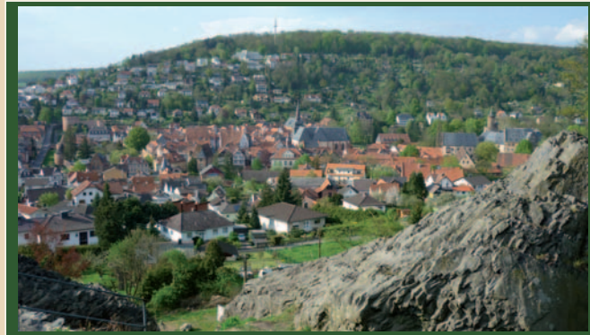
Blick auf die Altstadt – rechts davon ist vor Ort (nicht im Bild) auch ein großer Buntsandstein-Steinbruch erkennbar. Solche Steine wurden für die Altstadt verwendet

Der Wilde Stein liegt oberhalb der historischen Büdinger Altstadt, die vom hellroten Buntsandstein geprägt ist. Auf diese hat man vom Wilden Stein aus einen hervorragenden Blick. Vom Altstadtparkplatz aus erreichen Sie ihn nach Querung der Mühltorstraße, indem Sie der Straße „Zum Wildenstein“ folgen. An deren Ende nach einer Linkskurve finden Sie die imposante Felsgruppe, die Sie bequem über einen randlichen Weg besteigen können.